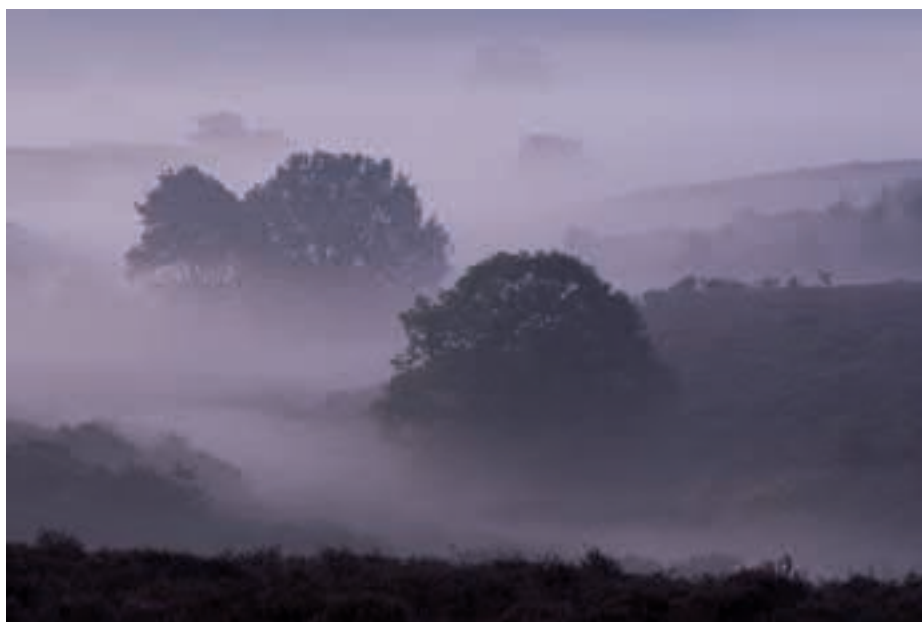
De winnende foto “Zonsopkomst op de Posbank”

Een bijzondere actie om aan de parken meer bekendheid te geven was de fotowedstrijd die samen met het maandblad Grasduinen is georganiseerd i.v.m. “100 jaar Nationale Parken”. In de maanden april en mei zijn de lezers van dit blad opgeroepen om hun favoriete plekken in de parken op foto’s vast te leggen. Met de wedstrijd wilde het SNP aandacht geven aan het feit dat het precies een eeuw geleden was dat (in Zweden) de eerste Nationale Parken van Europa waren ingesteld. In totaal zijn 1300 inzendingen ontvangen, waaruit begin oktober drie winnende foto’s zijn uitgekozen. Dank zij deze wedstrijd hebben de parken meerdere keren aandacht gekregen in het veel gelezen blad Grasduinen.